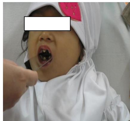
Gambar 2. Ekspresi wajah pasien

Pasien dikonsul ke bagian anak untuk dilakukan pemeriksaan keadaan umum, pemeriksaan darah, dan pemeriksaan radiologis. Hasil pemeriksaan dokter anak menunjukkan keadaan umum dan gizi baik, paru secara klinis dan radiologis dalam batas normal, pemeriksaan hematologis dalam batas normal, jantung di diagnosa atrial septal defect . Penderita dipersiapkan untuk tindakan mouth preparation dengan anestesi umum.