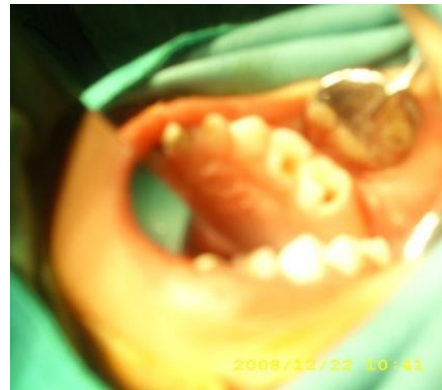
Gambar 5. Keadaan gigi geligi RA dan RB sebelum dilakukan mouth preparation

Instruksi pasca operasi antara lain kontrol nadi, suhu, dan respirasi tiap jam, puasa sampai BU (+) dan DU(+), infus RL diteruskan sampai intake cairan cukup, pemberian antibiotika ampisilin 3 x 200 mg dan Kaltrofen supp. 2 x ½.