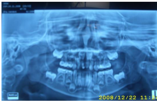
Gambar 4. Gambaran radiografi gigi geligi pasien pre operasi