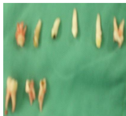
Gambar 7. Gigi geligi yang sudah di ekstraksi