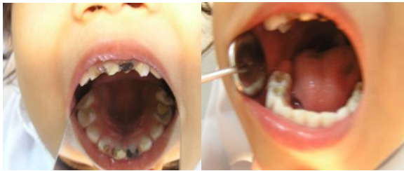
Gambar 3. Keadaan intra oral pasien pre operasi