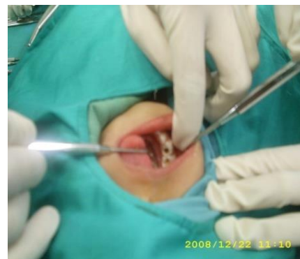
Gambar 6. Keadaan gigi geligi yg sedang di lakukan penambalan komposit