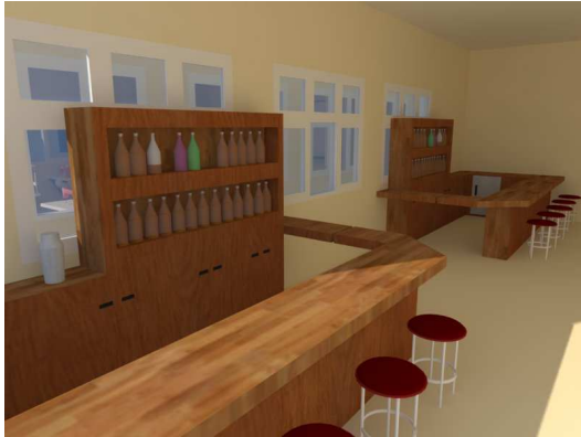
Ruang Praktek Mini Bar