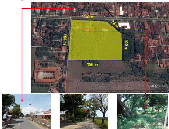
Gambar Lokasi Tapak

Lokasi tapak berada di Jl. Jendral Sudirman, Wanarejan, Pemalang. Luas tapak adalah ±2,5 Ha.