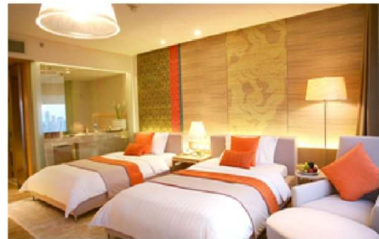
Twin Room Training Hotel