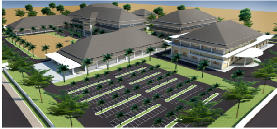
Sekuen Parkir dan Training Hotel