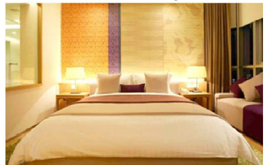
Suite Room Training Hotel