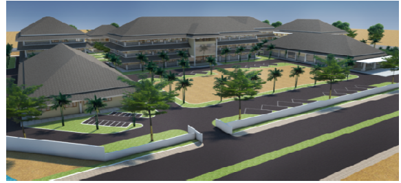
Sekuen Main Entrance