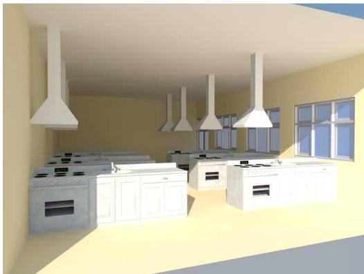
Ruang Praktek Dapur