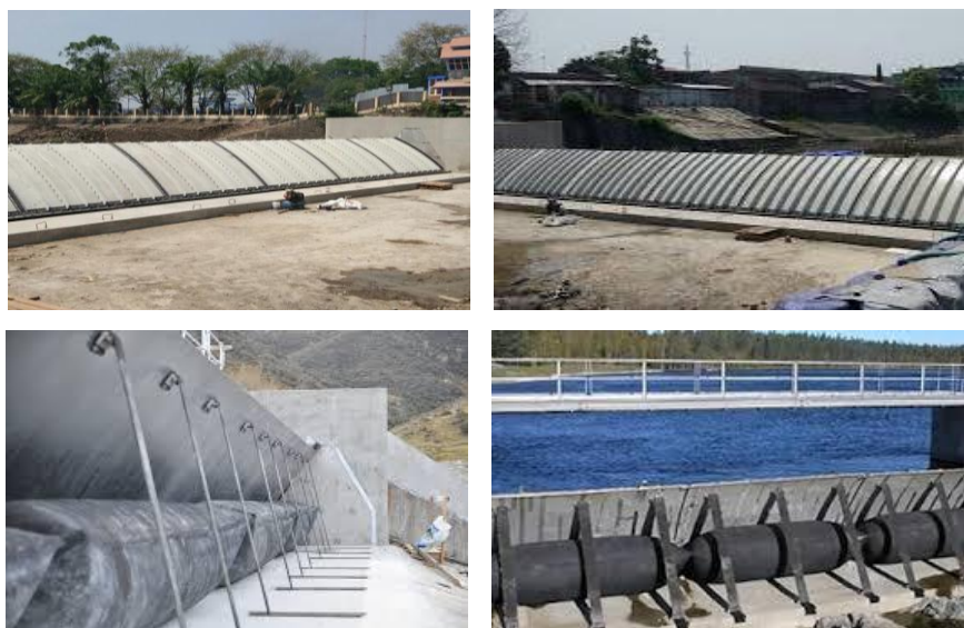
Gambar 2. Contoh Konstruksi Bendung Karet Berpelindung Baja di Kali Anyar/ Kali Pepe Surakarta (Balai Besar Wilayah Sungai Bengawan Solo, 2016)

sinar ultraviolet serta masih ada hal-hal lain yang lebih jika dibandingkan dengan bendung karet biasa.