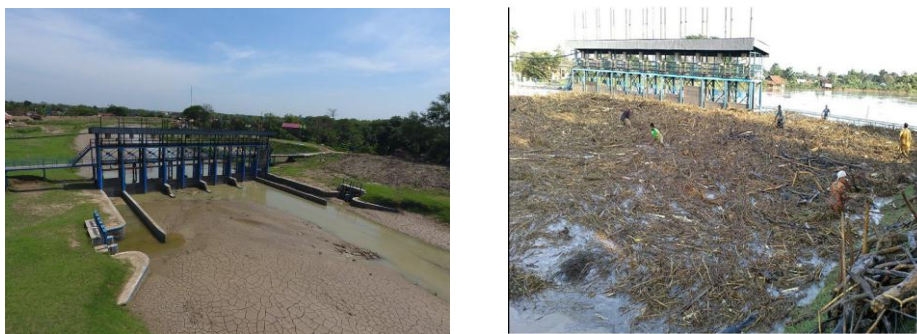
Gambar 1. Sedimentasi Bendung Guntur ; Blocking sampah di Hulu Bendung Guntur

Bendung Guntur berlokasi di Desa Guntur kecamatan Guntur kabupaten Demak dibangun pada tahun 1912-1914 pada masa pemerintahan Hindia Belanda yang merupakan Bendung Skot Balk dengan 10 buah lubang/pintu berupa Bendung Gerak dengan lebar pintu 2,50 m, pada 1974 oleh Proyek Jeratun Seluna (sekarang Balai Besar Wilayah Sungai Pemali Juana) Bendung Guntur direhabilitasi dengan menaikkan mercu + 0,90 m dan mengganti putaran-putaran pintu dari putaran samping ke putaran muka. Pada 1982, 10 pintu tersebut diganti dengan pintu sorong kayu yang digerakkan dengan tenaga listrik. Tahun 2008 pintu sorong kayu diganti pintu baja dan menaikkan tinggi mercu + 0,48 m dengan harapan bisa melewati debit banjir dengan baik. Akibat terjadinya kerusakan dibagian hulu sungai dan kurangnya kesadaran penduduk yang bertempat tinggal disepanjang sungai dalam membuang sampah sisa hasil pertanian, serta sedimentasi yang luar biasa, maka pada Bendung Guntur terjadi blocking sampah serta sedimen (Gambar 1) yang mengakibatkan banjir dibagian hulu bendung melimpas dan membuat tanggul jebol.