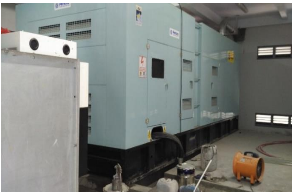
Gambar 1. Fondasi Mesin Genset Lube Oil

Dari latar belakang tersebut, maka dilakukanlah analisis dinamik fondasi mesin yang mengangkat permasalahan sebagai berikut: cara menentukan parameter dinamik tanah berupa modulus geser dan rasio redaman yang digunakan dalam desain fondasi mesin, penerapan metode Lumped Parameter System untuk menganalisis resonansi dan amplitudo pada struktur fondasi mesin, keamanan desain eksisting fondasi blok tidak tertanam dengan strauss pile berdasar analisis dinamik, pengaruh fondasi blok yang tertanam dengan strauss pile pada sistem fondasi mesin, pengaruh pile dalam desain sistem fondasi mesin tipe blok tertanam.