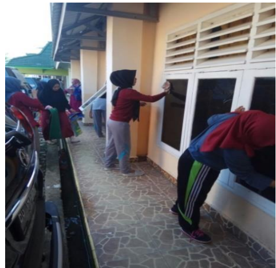
Gambar 4. Membersihkan laboratorium biologi