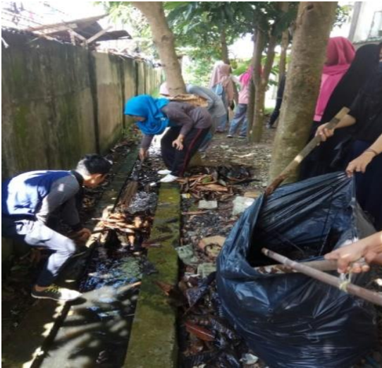
Gambar 1. Membersihkan saluran drainase