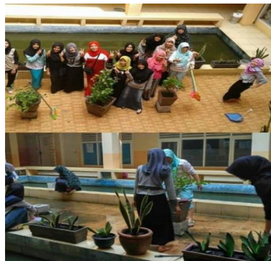
Gambar 6. Melakukan penghijauan dan penataan tanaman hias disekitar kolam