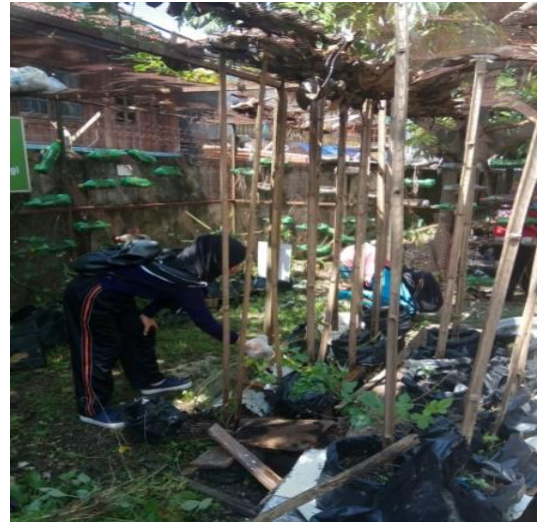
Gambar 2. Membersihkan kebun biologi