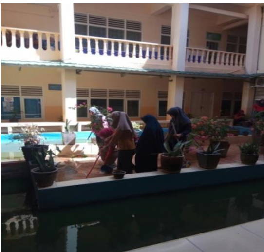
Gambar 5. Membersihkan selasar kolam biologi