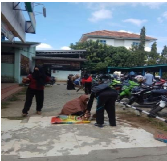
Gambar 3. Membersihkan halaman parkir