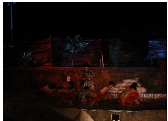
Gambar 9. Lighting Bagian 1 Pertunjukan koreografi “PETI=MATI”

Lampu yang digunakan, lampu pressnel filter warna hijau, biru dan kuning dan lampu general .