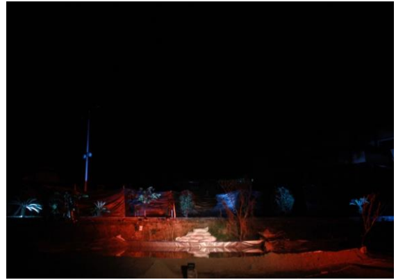
Gambar 8. Tempat Pertunjukan koreografi “PETI=MATI”

Tempat pertunjukan nantinya bertempat di halaman parkir gedung Pascasarjana Kampus ISI padang panjang. Halaman tersebut dirasa sesuai dengan setting koreografi yang memang senagaja dibuat imitasi seperti aslinya. Halaman tersebut cukup luas jika hanya di tarikan oleh 6 (enam) orang panri, maka pengkarya membatasi tempat pertunjukan dengan panjang 10 meter dan lebar 10 meter tempat pertunjukan. Pengkarya senagaja menggunakan tempat pertunjukan diluar gedung karena pengkarya menggunakan setting yang cukup banyak, apabila tempat perunjukan di gedung tidak memungkinkan untuk bongkar pasang setting setiap pengkarya latihan, di lain hal ruang latihan pun terbatas dengan jumlah orang penguana ruangan yang tidak sebanding. Maka pengkarya memutuskan untuk memilih tempat pertunjukan diluar ruangan. Selain itu pertunjukan di luar ruangan menjadi ruatu hal yang berbeda tersendiri, menurut pengkarya rasa gerak yang penari lahirkan lebih maksimal dibandingkan dengan pertunjukan didalam ruangan.