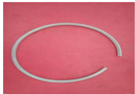
Gambar 2. Properti Koreografi "PETI=MATI"

Sebuah setting realistis di ciptakan atau dibuat untuk memberikan kepastian, memberikan gambaran kenyataan yang hidup dari sebuah gambaran atau kegiatan yang patut bagi pelaku. Adegan seperti itu dibuat merupakan angan-angan dari sebuah tempat dengan menggunakan bentuk-bentuk tiruan yang murni. Setting yang menciptakan tata panggung ini mencoba agar para penonton merasa dalam dirinya berada dalam tempat aslinya. Untuk membuat hasil sebuah adegan tiruan realistis, tidak berarti kita harus memberi gambaran tiruan yang lengkap dan bentuknya alami (natural). Koreografi "PETI=MATI" ini menggunakan setting yang dibuat seperti aslinya, setting dibuat seperti aslinya ini dirasa pengkarya sesuai dengan konsep yang di pilih dan membuat penonton dan penari seolah-olah memang berada dalam aktifitas PETI tersebut.