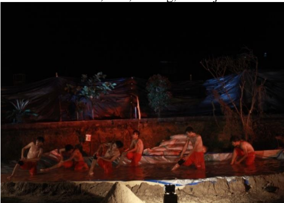
Gambar 11. Lighting Bagian 3 Pertunjukan koreografi "PETI=MATI"

Lampu yang digunakan, lampu general dan lampu pressnel filter merah, biru, kuning, dan hijau.