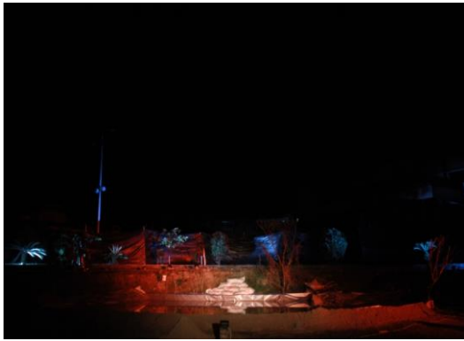
Gambar 3. Setting Koreografi 'PETI=MATI'