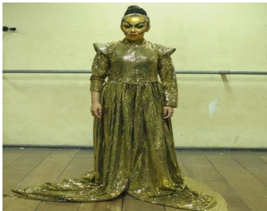
Gambar 7. Kostum Penari Putri koreografi “PETI=MATI”

Sedangkan penari putri menggunakan kostum yang bernuansa emas, karena penari putri pada koreografi diinterpretasikan oleh pengkarya sebagai emas tersebut.