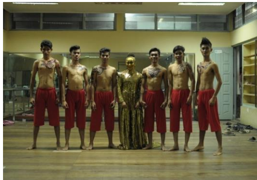
Gambar 1. Penari "PETI=MATI" (Dokumentasi: Rayhan Redha Febriam S.Sn, 2016)

Koreografi yang substansi pertamanya adalah gerak, media dari gerak tersebut adalah tubuh, peranan tubuh tidak hanya sebagai media tetapi tujuan utamanya adalah untuk menyampaikan gagasan. Agar tercapainya sasaran yang diinginkan maka peranan tubuh seorang penari sangat dibutuhkan dalam penggarapan koreografi. Memakai enam orang penari kelompok laki-laki dan satu orang penari perempuan sebagai simbol emas. Dengan enam orang penari kelompok dan dengan jumlah penari genap lebih gampang untuk pecahan gerak serta enam orang penari kelompok dianggap sesuai dengan ukuran panggung yang digunakan, panggung jadi tidak terlalu kosong/sepi ataupun panggung juga tidak terlalu penuh oleh penari kelompok sehingga penonton bisa dengan jelas melihat tiap gerakan penari. Postur tubuh penari memiliki tinggi yang tidak jauh berbeda atau sama tinggi, pemilihan penari di sesuaikan dengan karakter dari konsep koreografi yang digarap.