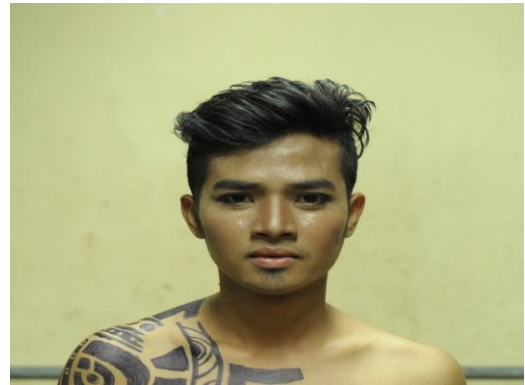
Gambar 4. Rias penari putra Koreografi 'PETI=MATI'