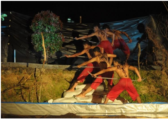
Gambar 10. Lighting Bagian 2 Pertunjukan koreografi "PETI=MATI"

(Rayhan Redha Febrian : Randi Idandri, 2016)