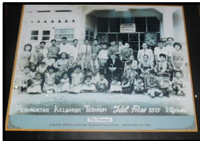
Gambar 1: Foto bersama keluarga Terinum di halaman Gedung Bioskop Nasional

Observasi yang dilakukan dibekas gedung bioskop Nasional masih ditemukan beberapa ornamaen yang menggambarkan suasana bioskop Nasional dari dekade 1950-1990an.