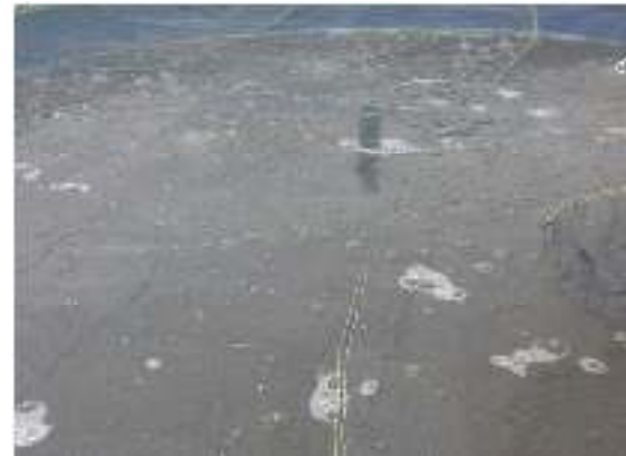
Gambar 4. Media Pemeliharaan

Pengontrolan pH setiap tiga hari sekali dilakukan dengan tujuan untuk mengetahui kerja bakteri. Jumlah flok dalam media pemeliharaan juga harus selalu dikontrol agar tidak terjadi blomming alga. Warna air pemeliharaan harus selalu dikontrol, dengan warna air berwarna coklat (Gambar 4.). Capaian tahapan ini adalah 100%, dimana flok dapat tumbuh dengan baik pada media pemeliharaan.