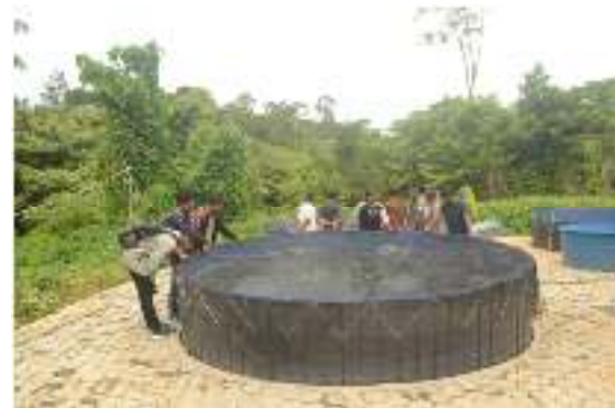
Gambar 3. Bak Terpal

dengan sistem bioflok. Langkah awal yaitu persiapan bak budidaya ikan lele yang akan digunakan. Kolam yang digunakan merupakan bak terpal dengan volume 8\text{m}^3 berbentuk bulat (Gambar 3). Sebelum digunakan terlebih dahulu bak terpal didesinfektan dengan menggunakan kaporit kemudian dinetralkan dengan menggunakan natrium thiosulfate.