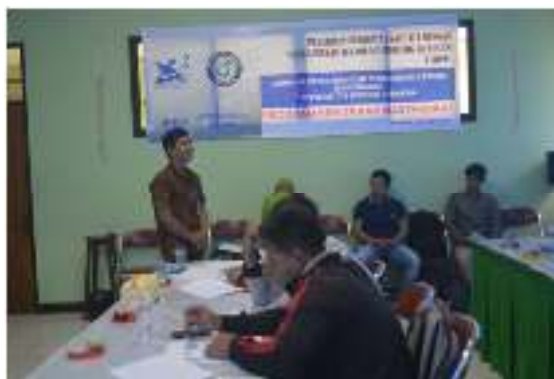
Gambar 2. Sosialisasi Teknik Bioflok

Tahapan sosialisasi meliputi persiapan, koordinasi dengan peserta dan kegiatan sosialisasi. Sosialisasi (pembekalan) materi tentang budidaya bioflok dilakukan di Fakultas Perikanan dan Ilmu Kelautan Universitas Borneo Tarakan dengan Mitra yaitu Kelompok Tani Karungan Maju Bersama. Sosialisasi dilakukan dengan tujuan untuk memberikan informasi tentang budidaya ikan lele dengan menggunakan sistem bioflok dan permasalahan yang dialami oleh kelompok mitra. Capaian kegiatan ini adalah 100%, dimana para anggota Kelompok Tani Karungan Maju Bersama, dapat mengikuti kegiatan sosialisasi serta terjadi diskusi yang aktif antara peserta dan pemateri (Gambar 2).