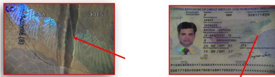
Gambar 2. Kerusakan pada Halaman Biodata Paspor

Pada halaman biodata paspor terdapat kerusakan berupa sobekan yang dapat dilihat dengan kaca pembesar. Sobekan tersebut mengindikasikan bahwa halaman paspor asli telah diubah dengan cara menempelkan halaman biodata palsu.