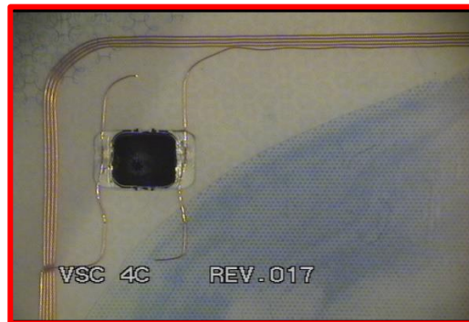
Gambar 5. Chip Paspor Rusak