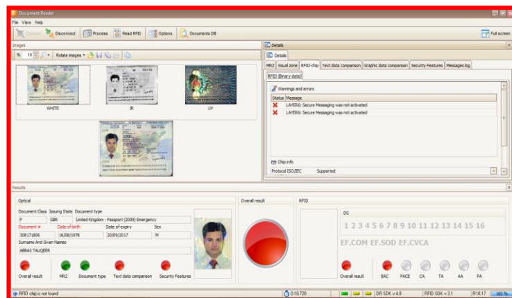
Gambar 6. Chip Tidak Terbaca pada "The Automatic Document Reader"

Kemudian pada saat dilakukan pembesaran, terlihat benang jahitan pada paspor sudah pernah dibuka. Diduga paspor tersebut telah dibongkar untuk dilakukan pemalsuan di beberapa halaman.