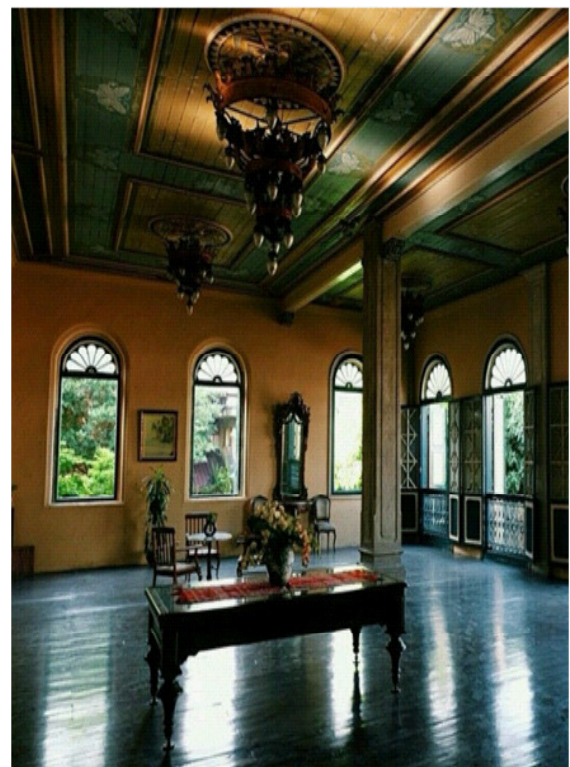
Gambar 3: Unsur Budaya Eropa pada rumah Tjong A Fie