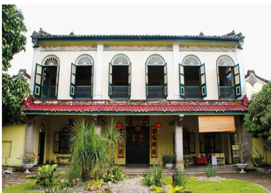
Gambar 2: Unsur Budaya Melayu pada rumah Tjong A Fie