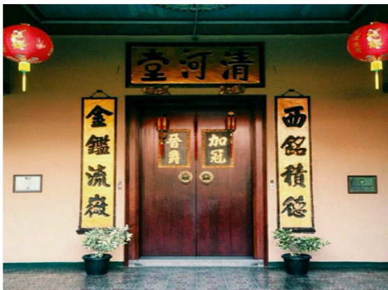
Gambar 1: Unsur Budaya Tiongkok pada rumah Tjong A Fie

Di antara ketiga kebudayaan tersebut, yang paling kental adalah budaya Tionghoa, kemungkinan besar karena pemiliknya adalah orang Tionghoa asli, kemudian karena bangunan ini terletak di Kota Medan yang penduduknya mayoritas penduduknya masih kental dengan budaya Melayu serta adanya hubungan baik antara Tjong A Fie dengan bangsa Eropa yang juga berada di Kota Medan pada masa itu, maka dimasukkanlah budaya Melayu dan Eropa ke dalam bangunan rumah tinggal Tjong A Fie.