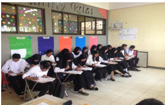
Gambar 1. saat melaksanakan uji lapangan

Dari hasil revisi yang dilakukan oleh uji ahli pembelajaran sosiolinguistik dan uji ahli pengembangan bahan ajar maka, produk pengembangan buku sosiolinguistik harus disempurnakan dan diperbaiki sehingga produk tersebut dapat diuji cobakan dilapangan