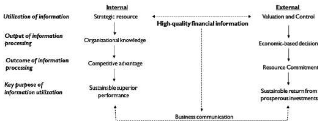
Gambar 2 Logika perspektif strategik pelaporan keuangan

Berdasarkan uraian tersebut, kajian ini mendefinisikan kualitas akuntansi dalam perspektif strategik sebagai (1) atribut; (2) yang potensial menghasilkan favorable outcome ; (3) sebagai konsekuensi keputusan yang melibatkan pelaporan keuangan; (4) sehingga memungkinkan perusahaan memperoleh kemanfaatan; (5) untuk menjaga eksistensi dan keberlanjutan proses bisnis yang diselenggarakan. Dalam hal ini, favorable outcome dapat diperoleh apabila pelaporan keuangan dihasilkan oleh sistem akuntansi yang penyelenggaraannya berorientasi pada (1) pemenuhan kriteria utama karakteristik kualitatif; (2) serta penciptaan kredibilitas (Hodge et al 2006). Sistem akuntansi yang demikian akan mendukung terciptanya transparansi dalam komunikasi perusahaan (Gaa 2009). Skema logika perspektif ini dapat digambarkan sebagai berikut: