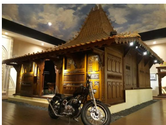
Gambar 3. Miniatur omah Gebyog Kudus