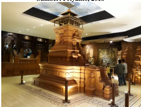
Gambar 2. Miniatur Menara Kudus