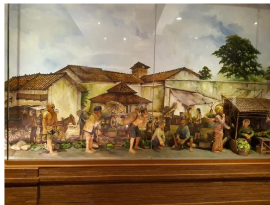
Gambar 4. Miniatur pasar kuno di kawasan Menara Kudus.