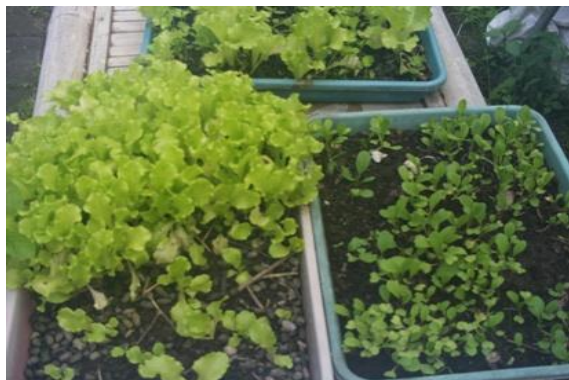
Gambar 2 Pembibitan Untuk Demplot Vertikultur

Penyiapan bahan tanam dalam demplot dilakukan memilih benih tanaman yaitu selada hijau, selada merah, seledri, sawi, caisin, bayam dan kangkung. Benih tanaman disemai terlebih dahulu sebelum ditanam agar tingkat keberhasilan dalam penanaman tinggi (Gambar 2).