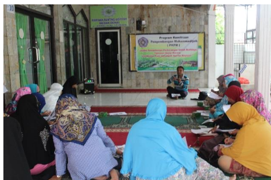
Gambar 1 Kegiatan Penyuluhan PKPM di Ranting Aisyiyah Medan Denai

bacaan/makalah agar dapat dimanfaatkan peserta penyuluhan secara berkelanjutan. Kegiatan penyuluhan berisi penjelasan tentang pemberdayaan perempuan, pengelolaan lahan pekarangan rumah dan teknologi vertikultur (Gambar 1).