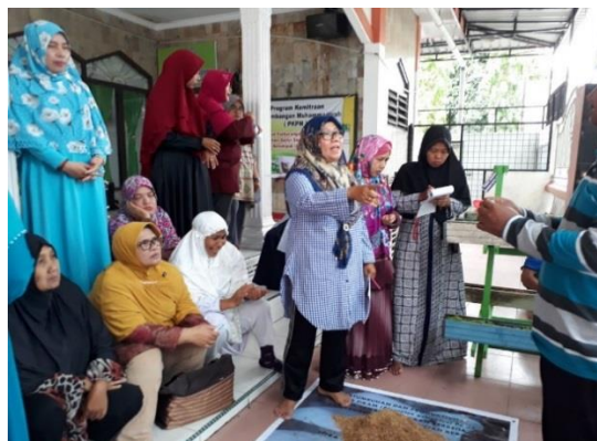
Gambar 3 Kegiatan Penyiapan Model Dan Medium Tanam Vertikultur

Kegiatan pelatihan merupakan tindak lanjut dari penyuluhan dan dilakukan untuk memberikan ketrampilan teknis bagi peserta program dalam menerapkan teknologi dengan cara melakukan kegiatan praktek langsung beberapa aspek teknologi vertikultur, antara lain penyiapan model, penyiapan medium tanam dan penanaman. Pelatihan dilakukan di pekarangan salah satu warga peserta program, dengan peserta terdiri dari ibu-ibu anggota Aisyiyah yang berminat berlatih teknologi vertikultur, dengan dibimbing oleh Tim Pelaksana dan dibantu oleh mahasiswa Fakultas Pertanian UMSU sebagai instruktur (Gambar 3).