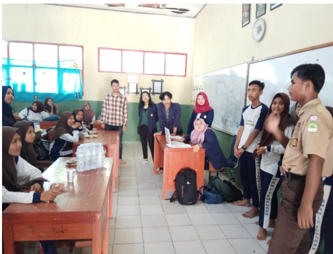
Gambar 2 Sosialisasi Pencegahan Radikalisme (kiri) dan Lokasi Sosialisasi di SMAN 1 Tempuran (kanan)

terhadap potensi ancaman radikalisme dimana target objek dari penyebaran radikalisme ini berada pada usia remaja. Materi yang disampaikan yaitu meliputi pemahaman konsep dasar mengenai radikal, radikalisme dan radikalisme, kemudian demokrasi dan demokrasi Islamik serta dijelaskan pula mengenai upaya pencegahan radikalisme berdasarkan pemahaman konseptual dan hasil dari eksplorasi dalam forum FGD. Antusiasme peserta sosialisasi terlihat ketika mereka menyimak materi yang disampaikan dan tingkat partisipasi yang tinggi dalam forum tanya-jawab atau diskusi. Materi yang disampaikan diselingi pula dengan cuplikan video yang relevan dengan materi sosialisasi.