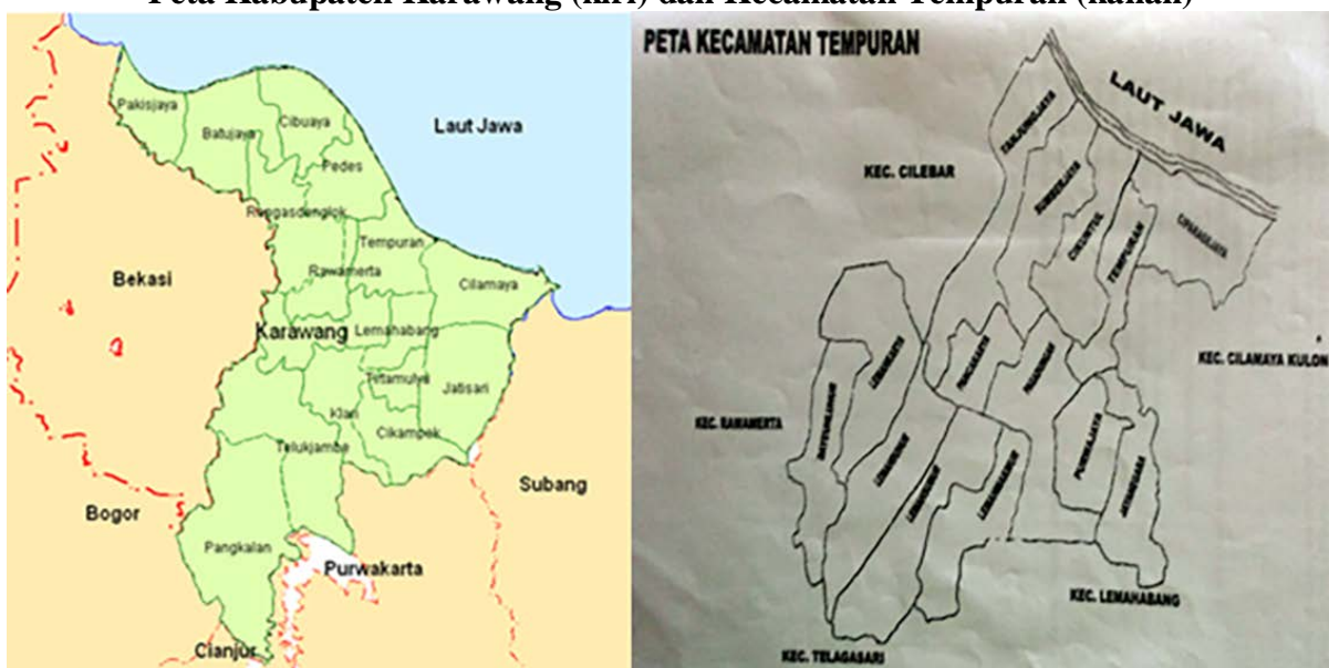
Gambar 1 Peta Kabupaten Karawang (kiri) dan Kecamatan Tempuran (kanan)

Kegiatan PPM ini diselenggarakan di Kecamatan Tempuran Kabupaten Karawang, dengan locus kegiatan di Desa Pancakarya dan SMAN 1 Tempuran. Kecamatan Tempuran merupakan salah satu kecamatan yang berlokasi di Kabupaten Karawang dengan 8.849 Ha, dengan jumlah penduduk 65.245 Orang di tahun 2016, dan 14 Desa.