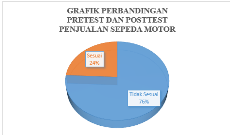
Gambar 4.1 Grafik Pretest dan Posttest

Dari hasil perbandingan diatas diperoleh grafik perbandingan di bawah ini :