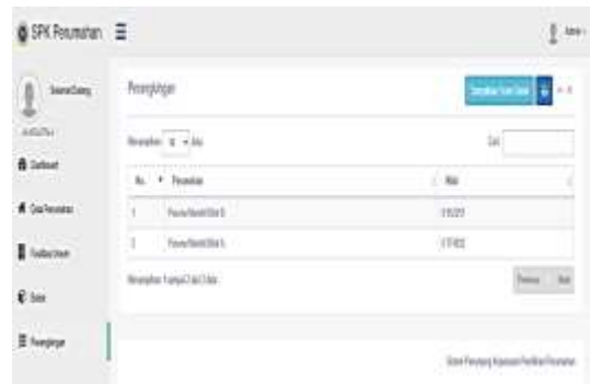
Gambar 4. Form Hasil Perangkingan Menggunakan Metode AHP

Pada form ini digunakan untuk melihat hasil perangkingan perumahan mana yang paling cocok bagi calon pembeli.