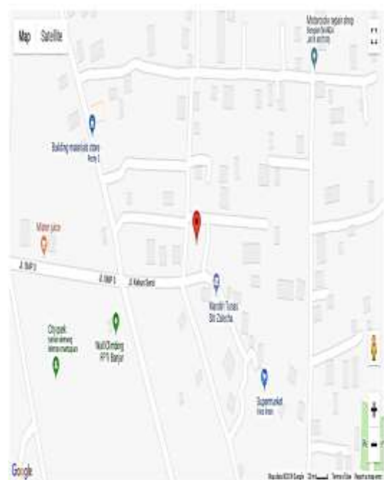
Gambar 5. Form Tampilan Google Maps Lokasi Perumahan yang Dekat Fasilitas Umum

perumahan berdasarkan fasilitas perumahan, harga, lokasi dan tipe perumahan dapat membantu calon pembeli perumahan dalam memilih perumahan yang sesuai dengan kebutuhan dengan metode perangkingan AHP