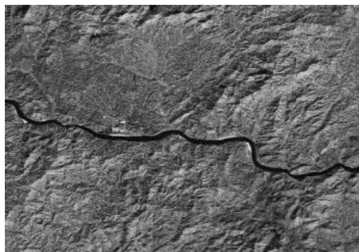
Gambar 1. Citra Ortokromatik Tidak Ada Noise

Adapun perbedaan antara citra ortokromatik yang memiliki noise dengan citra ortokromatik yang tidak memiliki noise adalah sebagai berikut: