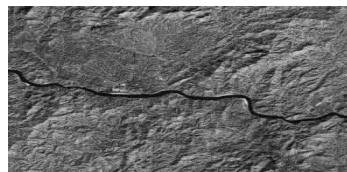
Gambar 4. Hasil Citra Noise