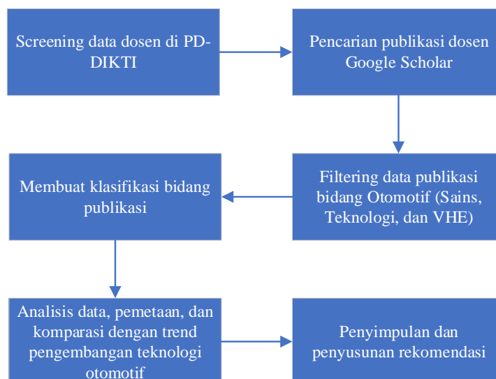
Gambar 1. Tahapan penelitian

Dalam studi ini, data dosen vokasi otomotif diperoleh dari Pangkalan Data Perguruan Tinggi ( https://forlap.ristekdikti.go.id/ ) untuk program D3 dan D4. Kemudian, publikasi setiap dosen dengan yang ber- homebase di program studi tersebut ditelusuri di google scholar. Selanjutnya, data ditabulasi dengan MS Excel untuk memastikan tidak ada publikasi yang terduplikasi karena terklaim pada list publikasi beberapa dosen. Data tersebut kemudian diklasifikasi, hanya publikasi artikel yang terkait dengan bidang otomotif saja yang diambil. Terakhir, data yang sudah terfilter tersebut diklasifikasikan berdasarkan bidang risetnya. Keseluruhan pekerjaan untuk mendapatkan data disajikan dalam Gambar 1 sebagai berikut.