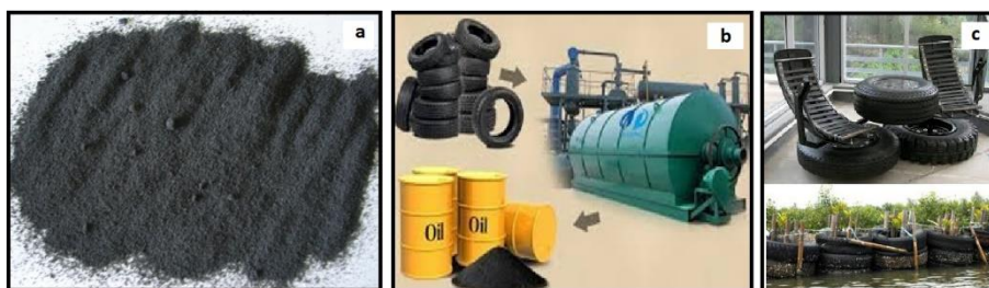
Gambar 4. Pemanfaatan ban bekas: (a). dibuat butiran untuk campuran aspal dan beton, (b) pirolisis untuk menghasilkan minyak, dan (c) daur ulang alih manfaat

dua proses utama, yaitu melalui pengolahan secara fisika atau kimia dan tanpa melalui pengolahan secara fisika atau kimia. Pemanfaatan melalui pengolahan secara fisika atau kimia seperti pada penggunaan untuk campuran aspal, campuran beton, filler, komposit, dan pirolisis untuk mendapatkan minyak cair. Sementara itu pemanfaatan tanpa pengolahan secara fisika atau kimia seperti pada alat pemecah ombak, alat peraga pendidikan, perabot, dan peralatan pendukung penambatan terumbu karang. Ilustrasi pemanfaatan ban bekas disajikan dalam Gambar 4 sebagai berikut.