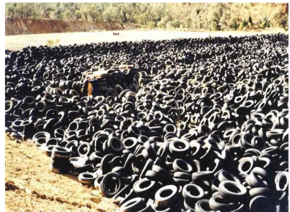
Gambar 3. Tertutupnya lahan akibat tumpukan ban bekas [6]

Artikel dalam Wikipedia tentang Tire Recycling [7], setidaknya ada 4 metode pemanfaatan ban bekas yang menjadi trend pengolahan ban bekas di dunia, yaitu sebagai bahan bakar alternatif dalam industri semen [8], dijadikan produk turunan [9], [10], pirolisis ban [11], dan daur ulang menjadi produk kesenian, ayunan, perabot, dan sejenisnya [12]. Bagaimana dengan trend riset pengolahan ban bekas di Indonesia? Dari penelusuran literatur, sampai dengan tahun 2019 ini kami belum