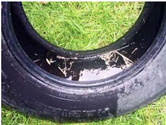
Gambar 2. Genangan air pada ban bekas sebagai sarang nyamuk [5]

Jika tidak dikelola dengan baik, timbunan ban bekas dapat menghadirkan ancaman kebakaran yang signifikan dan air yang terperangkap menyediakan tempat berkembang biak bagi nyamuk, yang dapat menularkan penyakit ( Gambar 2 ). Selain itu, penumpukan ban bekas pada skala besar juga menimbulkan tertutupnya permukaan lahan, yang mengurangi potensi tersedianya lahan terbuka hijau, sebagaimana diilustrasikan dalam Gambar 3 [4].