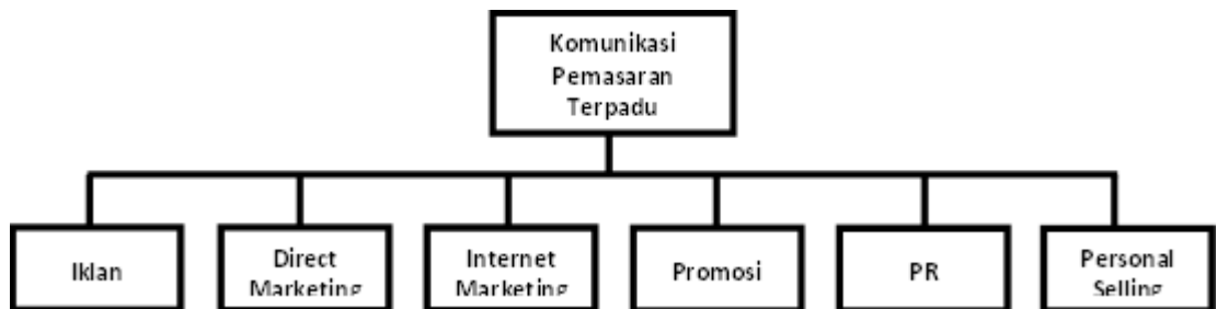
Gambar 2, model komunikasi pemasaran terpadu menurut George dan Belch

Model Komunikasi pemasaran Terpadu menurut George dan Michael Belch, sebagaimana dikutip Morissan, 2010: 17-30, bahwa komunikasi pemasaran terpadu merupakan sinergis antara aktivitas-aktivitas komunikasi pemasaran, sebagaimana digambarkan berikut: