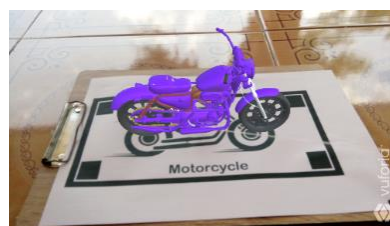
Gambar 4 Pengujian Marker terhadap sudut jemiringan kamera