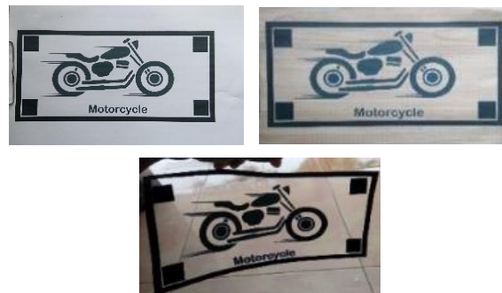
Gambar 2. Marker Media Pengujian

Masing-masing media diujikan terhadap intensitas cahaya, yaitu cahaya matahari dan lampu Neon. Pengukuran intensitas cahaya menggunakan aplikasi Lux meter dan untuk sudut kemiringan menggunakan aplikasi Clinometer . Gambar media pengujian adalah sebagai berikut: