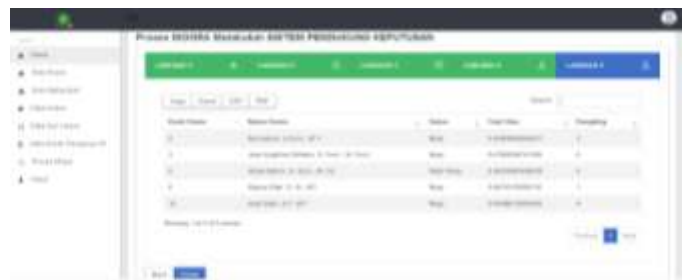
Gambar 3.11 Halaman Hasil dan Cetak