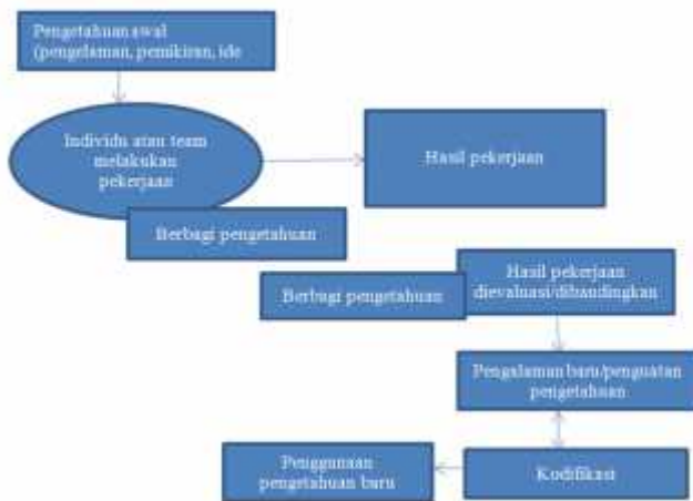
Bagan 1. Model penciptaan pengetahuan di Tim penggerak PKK Desa Cisondari

tanaman obat keluarga mulai dari penanaan tanaman di pekarangan masing-masing sampai pada pengujian khasiat tanaman obat tersebut.