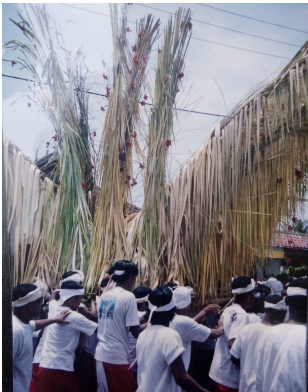
Gambar 2. Arak-arakan membawa simbol Tradisi Bukakak.

Kata Bukakak berasal dari kata Lembu yang melambangkan Dewa Siwa dan Gagak perlambang Wisnu. Bukakak juga berkaitan dengan babi guling yang hanya dimatangkan bagian dadanya saja. Warna babi guling dalam penyelenggaraan atau prosesi upacara Bukakak ini terdiri tiga warna, yaitu warna hitam pada punggung babi, pada bagian kiri dan kanan babi bulunya dibersihkan, sehingga berwarna putih. Sedangkan pada bagian dada babi tersebut berwarna merah karena dipanggang dengan matang. Babi guling tersebut kemudian diletakkan di atas banten sarad (jempana). Konstruksi atau tempat untuk menaruh babi guling tersebut, terdiri dari enam belas batang bambu. Kemudian dihiasi dengan daun enau muda ( ambu ) dan dilengkapi bunga pucuk bang (kembang sepatu berwarna merah). Pembuatan Bukakak dipercayakan kepada soroh (klen) Pasek Bedulu (gambar 2).