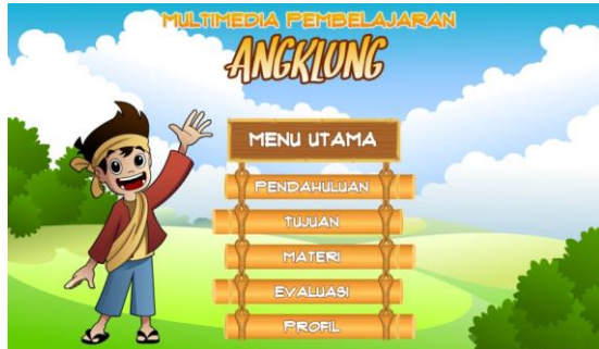
Gambar 1. Hasil Pengembangan Produk (Tampilan Menu Utama)

video, materi produk, dan grafis. Proses produksi dilakukan dengan menggunakan beberapa software sesuai dengan fungsinya. Adapun salah satu hasil pengembangan produk dapat dilihat dalam Gambar 1.