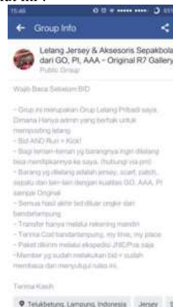
Gambar 4.1: Unggahan Peraturan Grup

Ini juga sesuai dengan peraturan yang tertera pada kiriman yang disematkan dalam grup. Disana tertera pada aturan yang paling atas yang tertulis : “Grup ini merupakan Grup Lelang Pribadi saya. Dimana Hanya admin yang berhak untuk memposting lelang” , seperti yang tertera pada tangkapan gambar berikut ini :