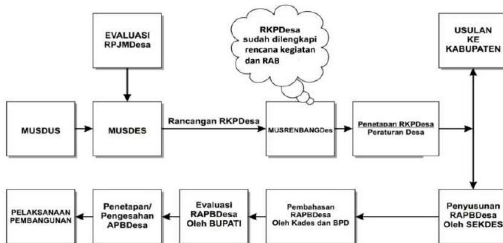
Gambar 1. Model perwakilan BPD dalam penyusunan APB Desa

Untuk itu, model ini mensyaratkan BPD yang benar-benar dapat mewakili dan mempunyai rasa empati terhadap kepentingan masyarakat luas. Namun, mekanisme pembentukan BPD melalui musyawarah yang sekarang banyak digunakan terkadang menyebabkan BPD dirasa tidak mewakili masyarakat, sedangkan di sisi lain anggota BPD sendiri merasa tidak memiliki tanggung jawab moral yang kuat terhadap masyarakat. Sehingga tanpa rasa empati dari anggota BPD dan juga tanpa kontrol dari masyarakat, maka model penganggaran "elitist" ini cukup sulit diharapkan dapat menciptakan pembangunan yang dapat benar-benar menjawab kebutuhan desa. Model perwakilan BPD dapat digambarkan sebagai berikut.