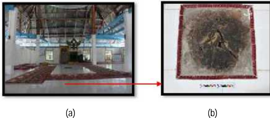
Gambar 1. Ruang utama Masjid Agung Bente tampak dari timur (a) dan Pusat Masjid (b)