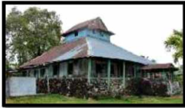
Gambar 4. Tampak atap Masjid Agung Bente dari arah selatan

beratap tingkat yang disebut meru pada masa kebudayaan Indonesia Hindu-Buddha dianggap sebagai bangunan suci tempat para dewa. Bentuknya yang kemudian diambil untuk bangunan masjid merupakan faktor penting menimbulkan daya tarik bagi mereka yang melakukan peralihan agama Hindu-Buddha ke agama Islam, sehingga tidak menimbulkan kekagetan budaya (cultural shock), terutama karena di dalam masjid diajarkan ketauhidan (Tjandrasasmita, 2009: 240).