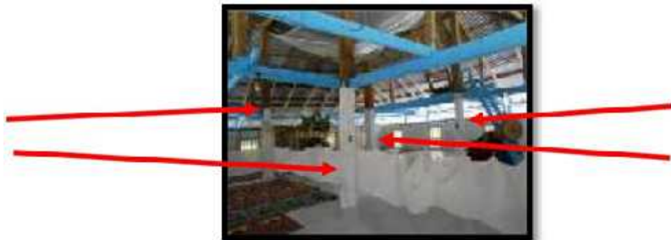
Gambar 2. Saka Guru (tuko belai'a) (lihat tanda panah)

Di dalam ruang utama Masjid Agung Bente (istilah lokalnya lala) terdapat saka guru (lihat gambar 2) yang berjumlah 4, setinggi 8 m dan berdiameter 30 cm. Salah satu saka guru sudah ada yang mengalami pelapukan, sehingga masyarakat menambahkan 1 tiang disamping saka guru yang lapuk untuk penopangnya yang di cat dengan warna putih untuk menyelaraskan antara warna saka guru dan dinding masjid. Saka guru berbentuk kotak, berbahan kayu besi dan di cat berwarna putih dan posisi saka guru ini tertancap menyatu dengan tanah sejak didirikannya Masjid Agung Bente. Secara mendasar saka guru atau dapat dipersamakan dengan tiang utama yang berfungsi sebagai penyangga utama konstruksi bangunan masjid. Namun di lokasi penelitian untuk penyebutan saka guru memiliki istilah lain, yaitu istilah lokal dengan nama tuko belai'a masyarakat biasa menyebutnya.