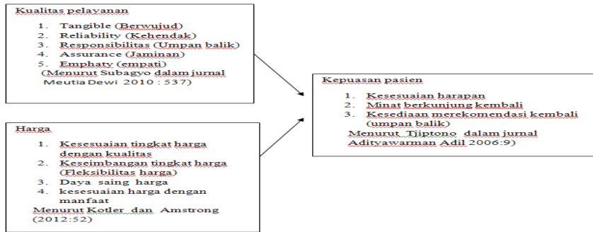
Gambar 1. Kerangka Pemikiran Pengaruh Kualitas Pelayanan Dan Harga Terhadap Kepuasan Pasien Pada Rumah M. Yunus Bengkulu.

Hipotesis dalam penelitian ini adalah sebagai berikut :