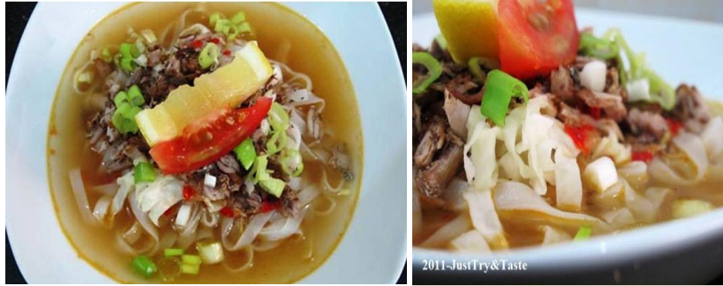
Gambar 1. Pantiauw [1]