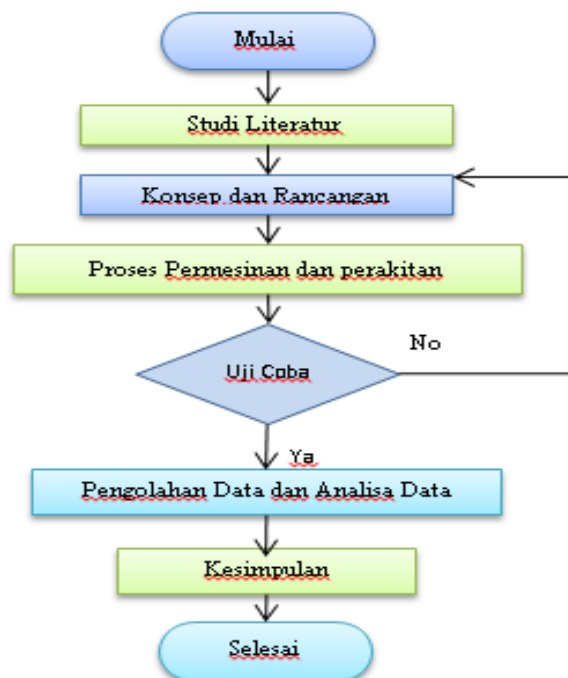
Gambar 2. Diagram Alir Penelitian

Pelaksanaan penelitian dilakukan dengan beberapa tahap yang digunakan untuk pedoman penelitian, langkah awal dimulai dari studi-studi literatur yang didapat dari jurnal ilmiah, internet, handbook, text book, manual book. Selanjutnya data-data studi literature dipelajari dan dijadikan referensi untuk melakukan penelitian. Uraian langkah-langkah tersebut tertuang pada diagram alir di gambar 2.