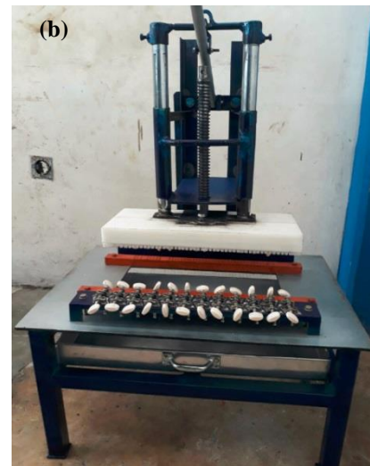
Gambar 3.(a). Gambar rancangan (b). Hasil Pembuatan Mesin