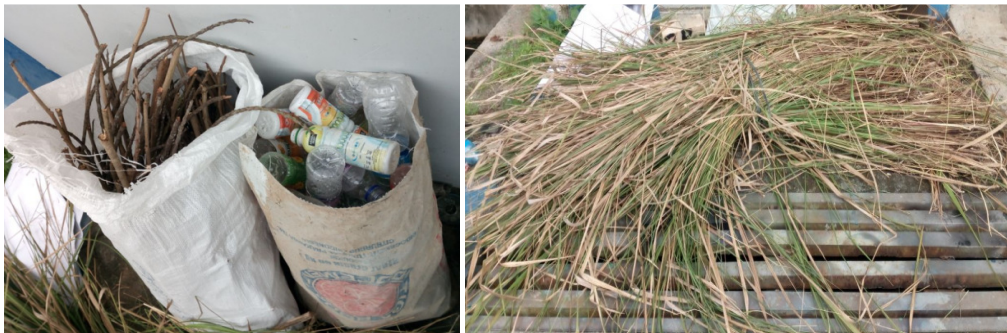
Gambar 3. Material Sampah