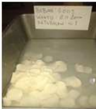
Gambar 4. Hasil Perajangan Singkong Menggunakan Beban 600 g