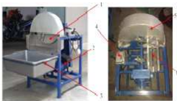
Gambar 1. Mesin Perajang Singkong

Adapun gambar mesin perajang singkong ditunjukkan pada gambar dibawah ini