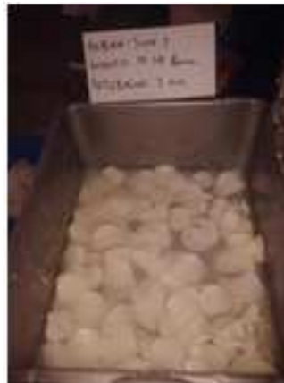
Gambar 3. Hasil Perajangan Singkong Menggunakan Beban 300 g

Hasil Perajangan Singkong dengan beban umpan 300 g, 600 g dan 900 g ditunjukkan pada gambar 3,4, dan 5