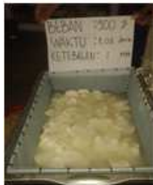
Gambar 5. Hasil Perajangan Singkong Menggunakan Beban 900 g