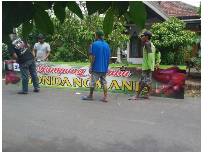
Gambar 8. Name Board yang sudah jadi dan dipasang

Warga desa Bandarkedung Mulyo bersama-sama berkoordinasi pemasangan name board /papan nama yang akan dipasang di gapura jalan masuk desa wisata jambu gondangmanis.