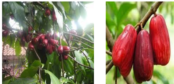
Gambar 2. Buah Jambu Gondangmanis

Berdasarkan hasil wawancara dengan kepala desa Bapak Suharno ada beberapa data yang bisa diperoleh yaitu, pada umumnya tanaman jambu bol tumbuh dan berproduksi pada dataran rendah hingga ketinggian 1200 m dari permukaan laut dengan lingkungan yang baik dan ternaungi dan cenderung tumbuh di daerah tropis basah. Tanaman jambu bol Gondangmanis mulai berbunga sekitar bulan April- Mei dan panen pada bulan Agustus-September. Persentase bunga menjadi buah (fruit set) sekitar 80 % per tandan. Umur simpan buah sekitar 3 hari dari panen pada suhu kamar. Daya tahan simpan ini merupakan permasalahan utama karena kulit buah jambu bol sangat tipis sehingga mudah lecet dan busuk.