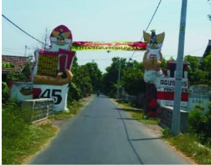
Gambar 9. Hasil Pemasangan Name Board