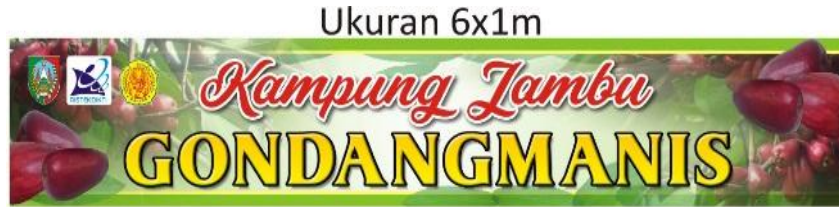
Gambar 5. Desain name board

Plat aluminium adalah lembaran plat atau pelat logam yang ringan dan kuat. Plat aluminium memiliki sifat anti karat, tidak mudah terbakar dan tahan terhadap segala jenis cuaca. Plat jenis ini sendiri mudah dibentuk, sehingga banyak digunakan dalam bidang industri seperti dalam kebutuhan advertising.