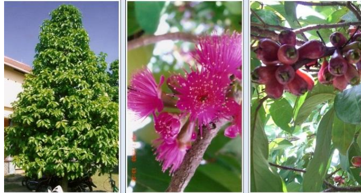
Gambar 1. Pohon, bunga dan buah jambu Gondangmanis Khas Jombang

Jumlah tanaman yang ada di desa Gondangmanis , kecamatan Bandarkedungmulyo kabupaten Jombang lebih dari 600 pohon dengan kisaran umur 10 hingga 30 tahun. Nampaknya di Jawa Timur pertanaman jambu bol yang ada dalam satu kawasan atau dalam satu desa dan telah diusahakan hingga peluang pasar sampai pasar swalayan hanya jambu bol Gondangmanis [5].