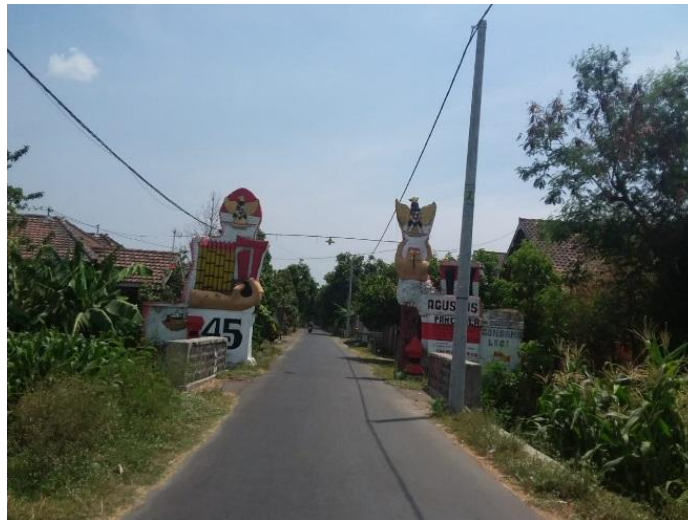
Gambar 4. Lokasi gapura peletakan Name Board

Kegiatan ini direncanakan akan direalisasikan di Desa Bandarkedung Mulyo Kabupaten Jombang dengan lokasi pemasangan papan nama di gapura jalan raya tepat di depan jalan masuk menuju lokasi petani penghasil Jambu Gondangmanis Desa Bandarkedung Mulyo.