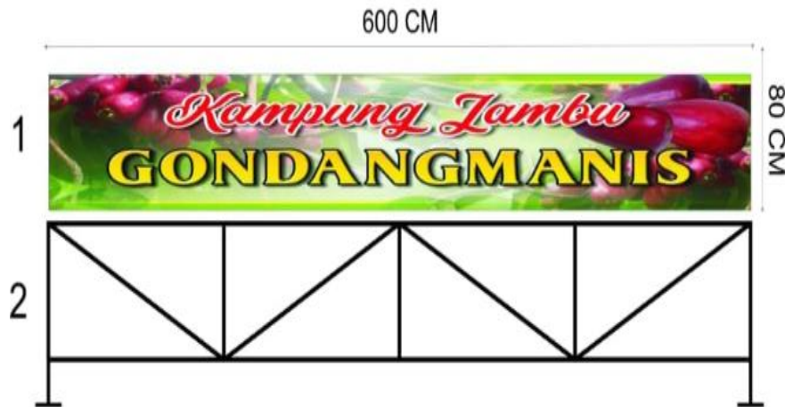
Gambar6. Rangka Besi

Saat ini hampir seluruh konstruksi bangunan menggunakan besi hollow. Bukan hanya mengutamakan kualitasnya yang kokoh, tapi saat ini konstruksi juga memperhatikan unsur estetika sebuah material bangunannya. Besi hollow cukup populer karena memiliki banyak kegunaan, baik untuk kanopi, pintu pagar, teralis modern, sampai pemasangan plafon gypsum dan plafon GRC board. Besi hollow umumnya terbuat dari besi galvanis, stainless, atau besi baja.