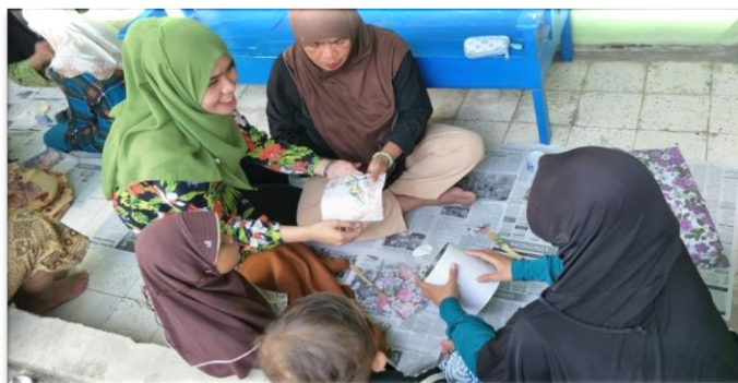
Gambar 2. Proses pengenalan kertas tisu sebagai bahan decoupage

Gambar 2 merupakan foto proses pengenalan kertas tisu sebagai bahan decoupage, bahwa kertas tisu yang dijual di pasaran cukup mahal harganya, untuk itu bisa diganti dengan pendesaianan pola sendiri dengan menggunakan kertas kado ataupun kertas koran.