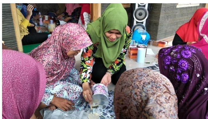
Gambar 3. Proses penempelan kertas tisu menggunakan teknik decoupage

Gambar 2 merupakan foto proses pengenalan kertas tisu sebagai bahan decoupage, bahwa kertas tisu yang dijual di pasaran cukup mahal harganya, untuk itu bisa diganti dengan pendesaianan pola sendiri dengan menggunakan kertas kado ataupun kertas koran.