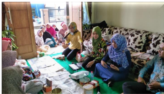
Gambar 1 Pemberian Materi kepada Ibu-Ibu PKK RT.07 RW.01 Pesurungan Lor

Pada Gambar 1 memperlihatkan penyampaian materi pengabdian kepada masyarakat yang diikuti oleh ibu-ibu PKK RT. 07 RW. 01 Pesurungan Lor. Penyampaian materi diberikan oleh tim PKM dan dibantu oleh dua orang mahasiswa.